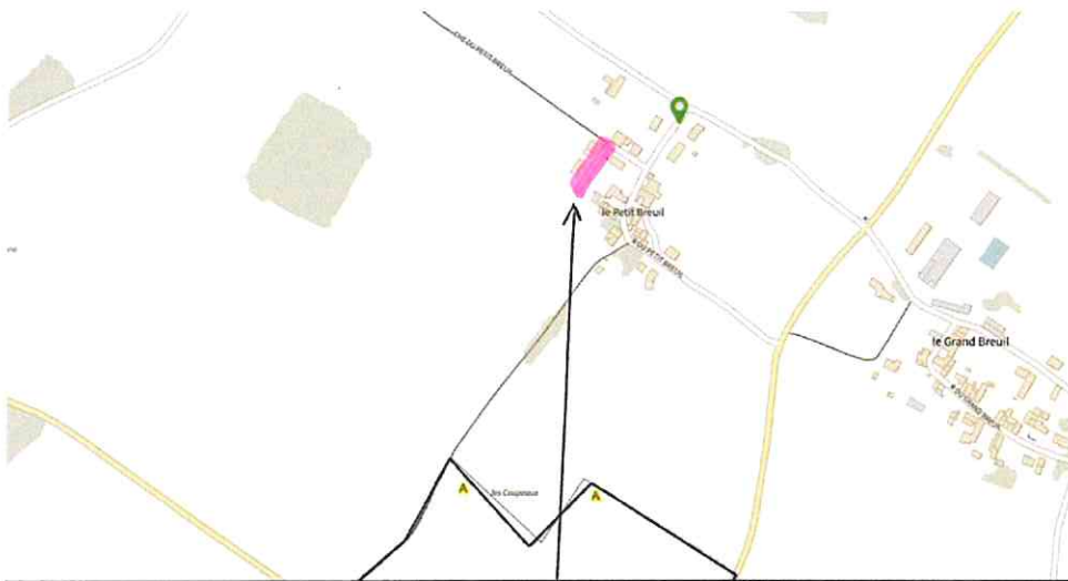
Impasse du Petit Breuil